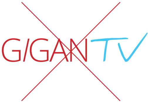
Aplicación incorrecta de colores