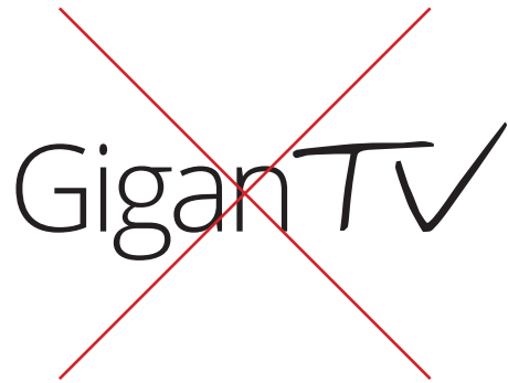
Alteración en la escritura