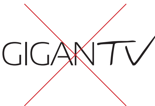
Cambios de tipografía