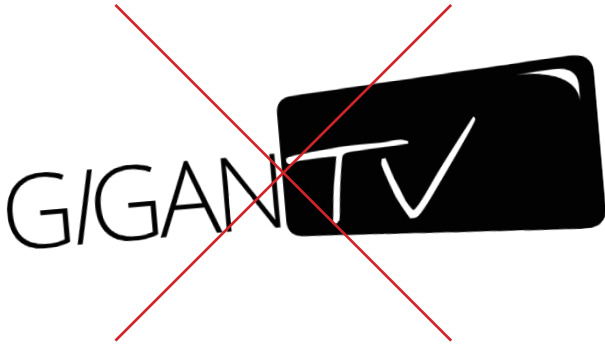
Rotación de la imagen