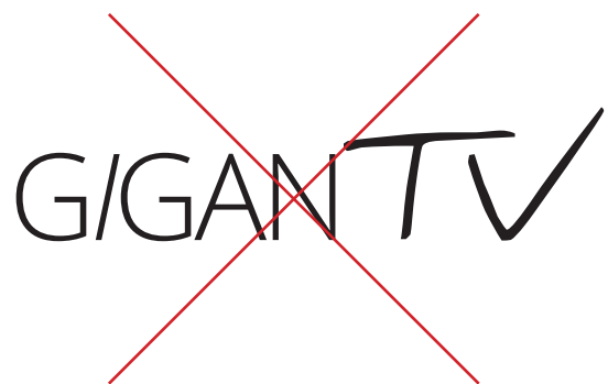
Alteración de los elementos

Es imprescindible evitar los usos incorrectos o alteraciones de la marca, que a su vez impactan con la identidad corporativa general y la impresión que ésta genera.